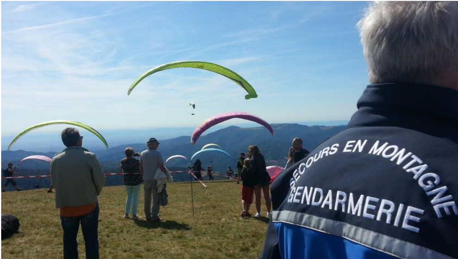
TABLE RONDE SUR LA SECURITE